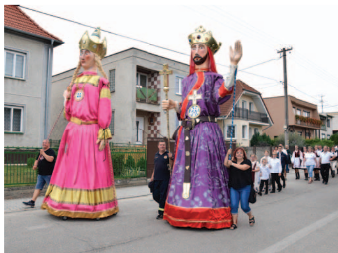
Folklórcsoportok felvonulása Sprievod folklórnych skupín