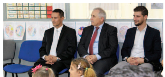
Rákóczi Szövetség képviselői iskolánkban