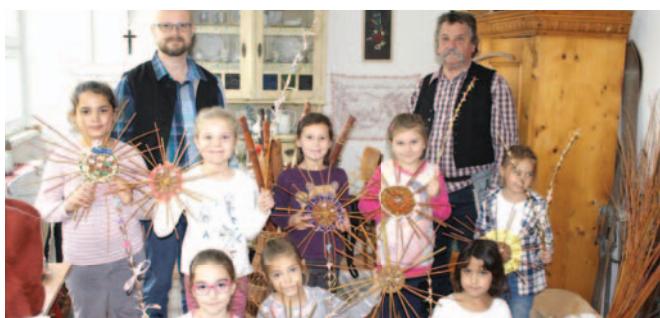
Vásári fergeteg – kosárfonás