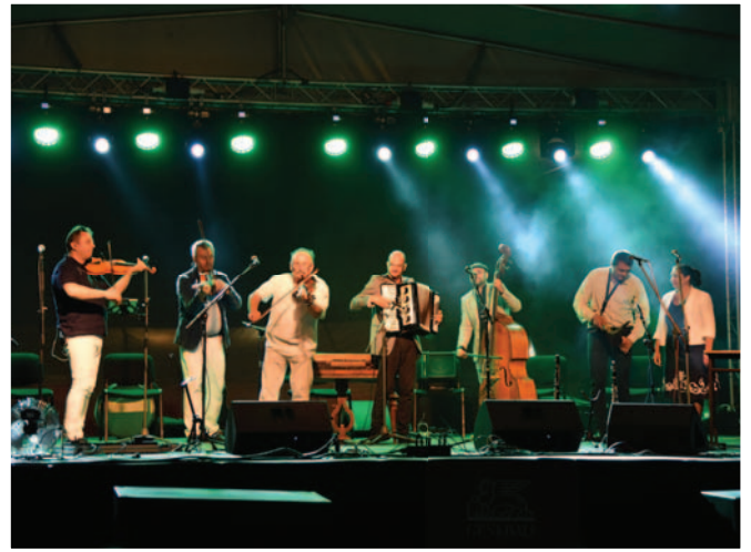
Csík zenekar Skupina Csík