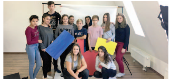
A Zmeták Galériában jártunk