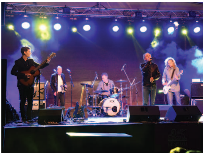
Varga Miklós és a Band Skupina Varga Miklós és a Band