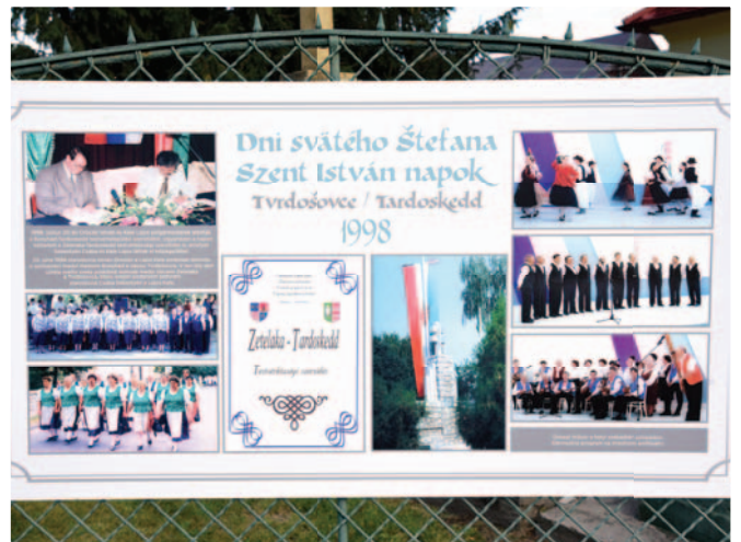
Fotóriport a Szent István Napokról 1998-2017 Fotoreportáž z osláv Dní sv. Štefana 1998-2017