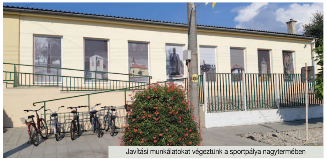
Javítási munkákat végeztünk a sportpálya nagytermében

Az elmúlt hónapokban is több olyan munkát vittünk véghez, amelyek a lakosaink, a község javát szolgálják. Kifestettük a temetőtemplomot, megjavítottuk a templomkerítés alapzatát, a szabadtéri színpad padjait. Javítási munkákat kellett elvégeznünk többek között az alapiskolák