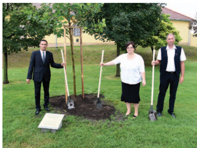
Emlékfa ültetése a partnerkapcsolat 20. évfordulójára Sadenie stromu k 20. výročiu družobného vzťahu