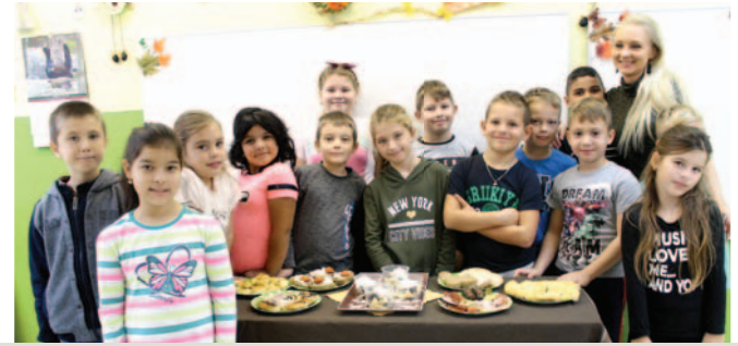
Egészséges nap az iskolában