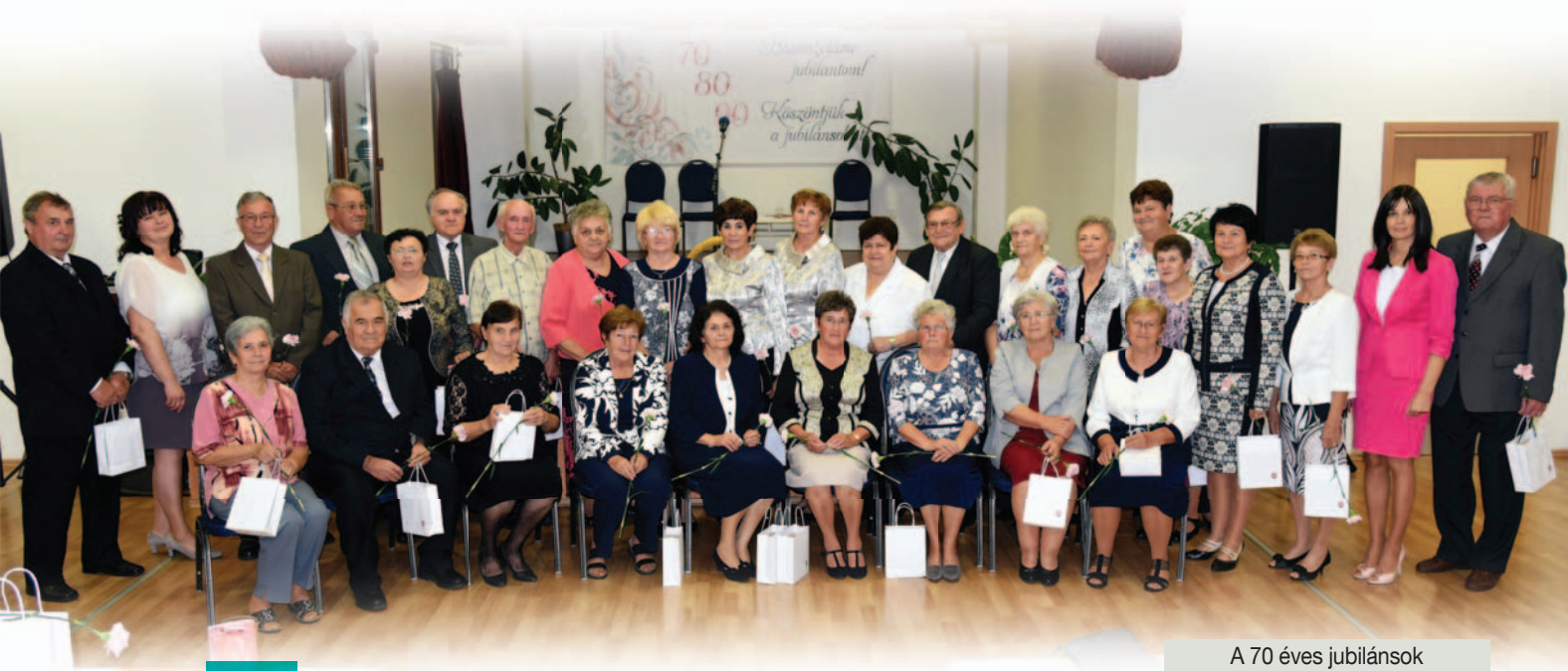
A 70 éves jubilánsok

Nektek fiatalabbaknak, akik még nem éltétek meg ezt a szép kort, mi jubilánsok azt kívánjuk, hogy ti is éljétek meg ezt a szép 70, 80, 90 évet, erőben, egészségben, boldogságban, békeségben és sok-sok szeretetben, megbecsülésben szeretett családok körében.” bsz