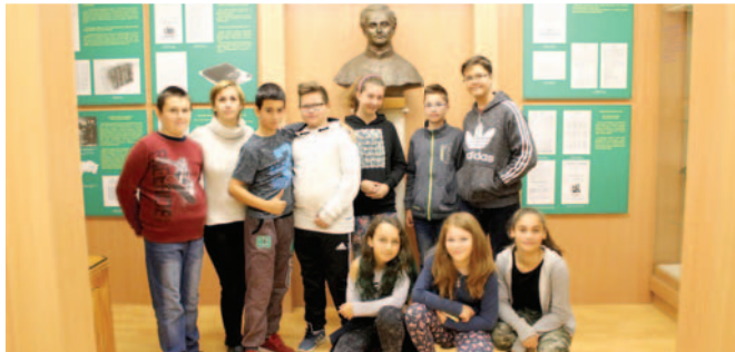
Thain János Múzeumban