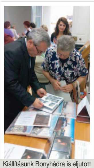
Kiállításunk Bonyhádra is eljutott

mihályúr csapata szerezte meg. A csapatok helyezési sorrendje: