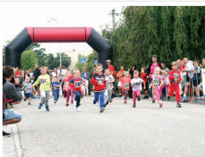
IV. Szentisván-napi futás IV. Svätostefanský beh