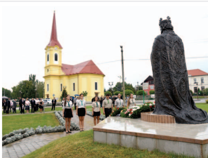
Szent István szobor megkoszorúzása Uloženie vencov k soche sv. Štefana