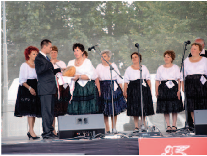
A bonyhádi Felvidékiek Kórusának augusztus 20-i kenyere Chlieb „20. augusta” od zboru Felvidék v Bonyháde