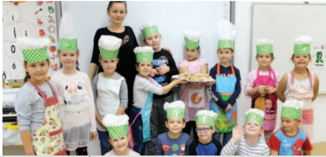
Élelmezés világnapja az iskolában