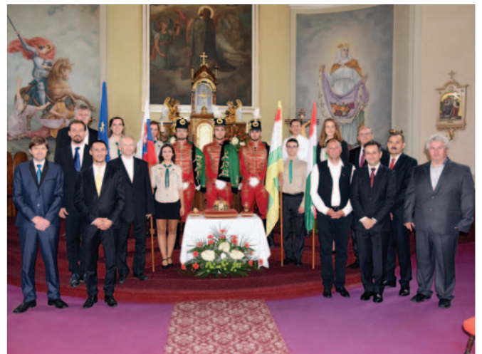
A Szent Korona mása Tardoskedden Kópia Svätej Koruny v Trdošovciach