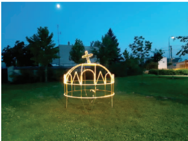
Szent Korona a Faluház mellett Svätá Koruna pri obecnom dome