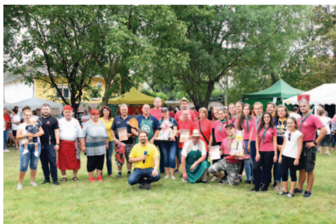
A főzőverseny legsikeresebb résztvevői és a győztes Tardoskedi Önkéntes Tűzoltók Egyesülete Najúspešnejší účastníci súťaže vo varení a víťazi: Dobrovoľný hasičský zbor Tvrdošovce