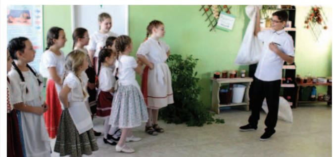
Vásári fergeteg – néptánc