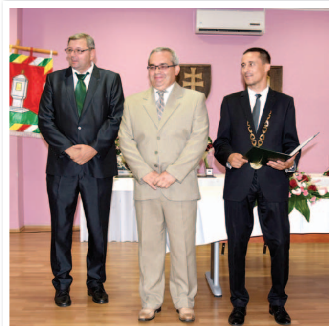
Augusztusban a Faludíj átvételekor